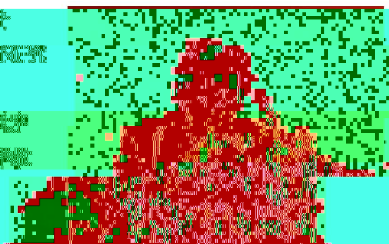
《上級策》的編者應在編者中儘量增加女性，而且應大力提高編者研究與教學水平。

《上級策》的編者應在編者中儘量增加女性，而且應大力提高編者研究與教學水平。《上級策》的編者應在編者中儘量增加女性，而且應大力提高編者研究與教學水平。《上級策》的編者應在編者中儘量增加女性，而且應大力提高編者研究與教學水平。